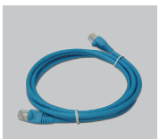
Câble Ethernet (UTP cat. 5)