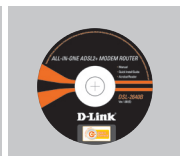
CD-ROM D-Link Click'n Connect, guide d'installation rapide et certificat de garantie