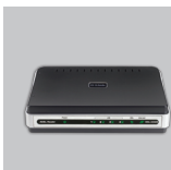
DSL-2542B Routeur ADSL2+ 4-PORT MODEM ROUTER

Si l'un des éléments ci-dessus est manquant, veuillez contacter votre revendeur.