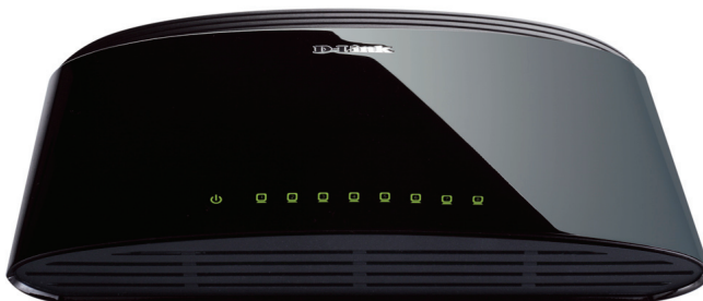
Commutateur Ethernet rapide 10/100 Mbps DES-1008D

L'illustration ci-dessous montre le panneau avant du DES-1008D.